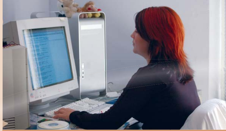
Werken onder ideale omstandigheden